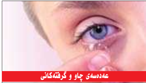
عہدہ سہی چاو و گرفتہ کانی

■ سہرنوسہر فواد سدید Editor-in-Chief Fuad Sideeq fuadsdeeq@hotmail.com ۰۶۶ ۲۲۳۲۸۵ ۰۶۶۲۲۳۰۳۰۰