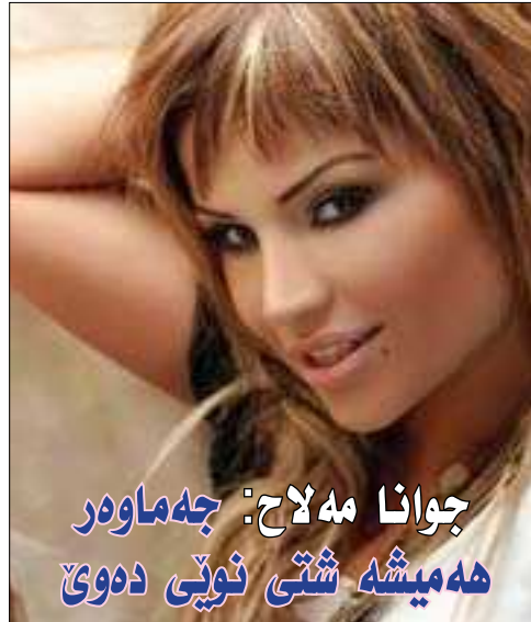
جوانا مہ لاج: جہ ماوہر مہمیشہ شتی نوئی دہوی