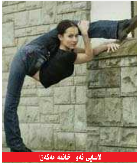
لاسانی ٹہو خانمہ مہکھن!