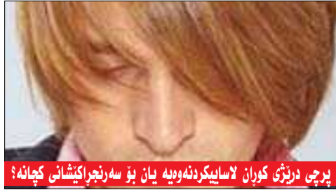
پرچی درتڑی کوران لاسایکردنہوویہ یان بڑ سہرنجراکیشانی کچانہ؟

■ ناوونیشن: ہولیز - شہ قامی ۴۰ مہتری تہنیشٹ مہکتہبی ناوہندی راگیانندی (پ.د.ک)