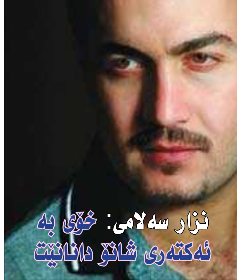
نزار سہ لامی: خوی بہ نہ کتہری شانہ دانائیت

■ جیگری سہرنوسہر فہرہاد محمہد Deputy Editor-in-Chief Farhad M.hassn frhd_mhmd@yahoo.co.uk Farhadmohmad@gulan_media.com تہلہ فون: ۲۲۳۱۵۲۷