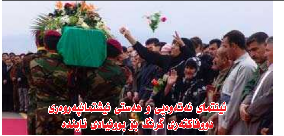
نیشنل نئے تہوہی و ہستی نیشنل پتھر و ہری دوفاکتہری گرنگ بڑ پوئیادی نائندہ

■ خاوند نیشنل شہوکت شیخ یزدین Concessioner Shewket Sh. Yezdeen