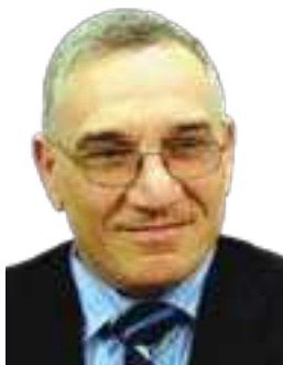
فهیسەف دەباغ تایبەت بۆ گولان ددینوو سی

بیات، به تایبەتی لهو پارێزگایانە ی که دهنگیکی باشی هیناوه، نهک لهو پارێزگایانە ی که دهنگهکانی تیا لاوازه.