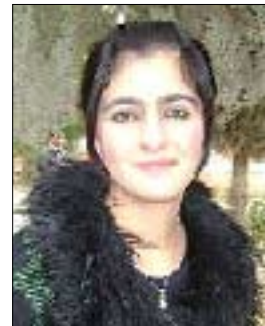
كچىك: بەراي من گىرنگ ئەو ەيە شىۋازەكە لەگەل دەمووچاوى بگونجىت

(دىندار ھەمەد) زۇر ھەز دەكات قۇرى دىرئىت بىت ئەو ەيە لەبەرئەو ەي خۇي ھەز لەو دەكات نەك بۇ سەرنجراكىشەنى كىچ، دىندار پىنى وابو كە خەلك پىيان خۇش نىيە ئەو پرچى دىرئىت بىت، بەلام ئەمە ئارەزووى خۇيەتى و گوى نادات بە قەسى خەلك. لە دوا قەسەيدا دىندار گوتى "زىياتر لەھەموو شىتېك بايەخ بە قۇم دەدەم، لەبەر ئەو ەي ھەست دەكەم جوانى قۇ كارىگەرى زۇرى ھەيە لەسەر جوانى خۇم و قۇرى كورتىش لەگەل روخسارم ناگونجىت"