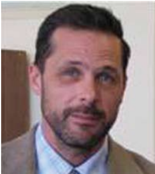
ئەندريۇ شاپېن مامۆستا لە زانکۆی كاليفورنيا:

(ئەندريۇ گلېن شاپېن) ماستەرى لە بواری ميژوو لە زانكۆی كاليفورنيا لە ئەمريکا بە دەست ھېناوہ و شارەزايەکی زۆر و چەند ليكۆلینەوھيەکی لەسەر گەنجانی ئەمريکا ھەيە و بە ھوکی ئەوھي بۆ ماوھي چەند سالیکیش لە کوردستان ژياوہ شارەزايەکی باشي لەسەر گەنجانی کوردستان و بەتايبەتی چيني قوتايان پەيدا کردوہ. ئەندريۇ لە زانکۆکانی كاليفورنيا و زانکۆی شانغی لە چين و زانکۆی ووسۆنگ لە کۆريای باشور و زانکۆی ئەمريکی لە ئەفغانستان و چەندین زانکۆی تر وانەي وتۆتەوہ. گولان لە گفتوگۆيە کدا پرسى گەنجانی رۆژھەلات بە گشتی و کوردستان بەتايبەتی لە گەل بەرپۆيان تاوتوی کرد.