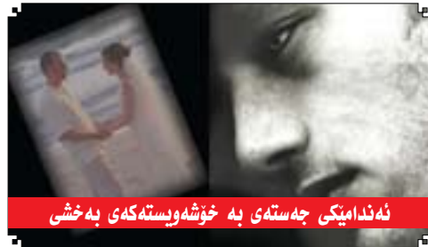
نه ندا میکی جه سته می به خوشه ویسته که می به خشی