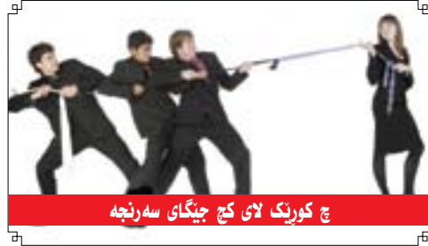
چ کوریک لای کج جیگای سه رنجه

■ سه رنو سه ر فوناد سدیق Editor-in-Chief Fuad Sideeq fuadsdeeq@hotmail.com ۰۶۶ ۲۲۳۲۳۸۵ ۰۶۶۲۲۳۰۳۰۰