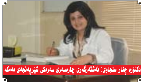
دکتوره چنار سنجای: نه شته رگه ری چاره سه ری سه رده کی شیر به نجه می مه مکه