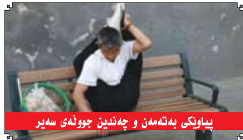
پیاویکی به تهمهن و چه ندین جوونه می سه سیر