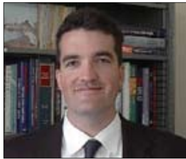
سكۆت ديسپۇساتو بۇ گولان:

خستىە روو و بەراۋركردنى لەگەل ولانتانى دىموكراتى جۆرىكە لە پىناسەكردنەۋەى پارتى سىياسىيە لەكۆمەلگەى دىموكراتى، ھەر بۇيە لە پرسىيارىكى دىكەماندا سەبارەت بە نوپكردنهۋەى سىياسىيە نىۋ پارتە سىياسىيەكان رۆلى كۆنگرە لەزىانى پارتە سىياسىيەكاندا، پروفىسۇر چادورى بەمجۇرە ۋەلامى پرسىيارەكەى گولانى داىۋەۋە وتى: ((پارتە سىياسىيەكان، لە رابردوۋ و لە ئەمرۇش، ھەۋل دەدەن بۇ بەرپۆشەۋەبەردنى شىۋازى بەرپۆچوۋىسى كارەكانى پارتەكانىان. ھەر پارتىكى سىياسىيە ھەمىشە ھەموۋ ھەۋلەكانى دەخاتەگەر لەپىناۋى ھىنەناۋەۋەى ئەندامى