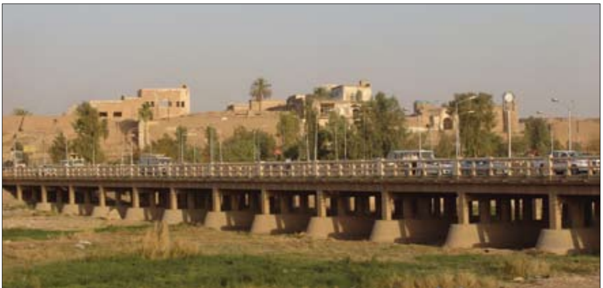
۵۰۰ هه زار عه رب هاتوه ته که رکوک و ناوچه کانی ده که

و بیته قه ی بایه عی به پروه ده چیت، له کاتیکدا خیزانی وا هه به دوو سه ی بیته قه ی به شه خۆراکی هه به. ئیفلیج کردنی سه رزمیری مه به ست لیبی ده رنه خستنی ژماره ی دانیشتوانه که له زۆر بوارداه او کیشه کان ده گۆریت بۆ نمونه کاتیک به شه داها تی پارێزگاکان و هه ری کوردستان دیاری ده کریت به پیی ژماره ی دانیشتوانه، واته کاتیک کوردستان به شیوه به کی خاوی ن و دوور له ساخته کارییه وه نامازه به ژماره ی دانیشتوانی ده کات ئه و بو ده ی دیاریکاری خۆی بۆ ته رخان ده کریت به لآم له کاتیکدا که له پارێزگاکانی تر ساخته کاری و فیلی ده کریت نالیژده به شه بو ده ی هه ریم که م ده بیته وه. چونکه به زیاده بوونی ریزه ی خۆی ئۆتۆماتیکیه ن ریزه ی کوردستانی که م ده کات. کاتیک به خه ملاندن ده لاین ژماره ی دانیشتوانی عیراق نزیکه ی ۳۲ ملیون و ۸۰۰ هه زار که سه ئه مه ژماره به کی زۆره دووره له راستیه به، ئه م ژماره به بۆ هه لبژاردنه به ره له مانی به که سه ی عیراق دانرا چونکه زیاده بوونی دانیشتوان ژماره ی کورسییه کانی پارێزگاکانی ناوه راست و خاوری عیراقی پی زیاد ده کرا به تایبه ت ژماره ی کورسییه کانی موسل ئه مه ش له به رژه وه ندی عه ربدا بوو. به مشیوه به دواخستنی سه رزمیری پیوه ندی به هۆکاری هونه ری و ناماده کارییه وه نه بوو، ته نانه ت راهینانی بژمیره کانی ئه نجامدرا بوو، ئه م کاره پیلانیکی وه زیری پلاندانانی عیراقه که بۆ دووه مجاره پروژه سه که شکست پی ده یته.