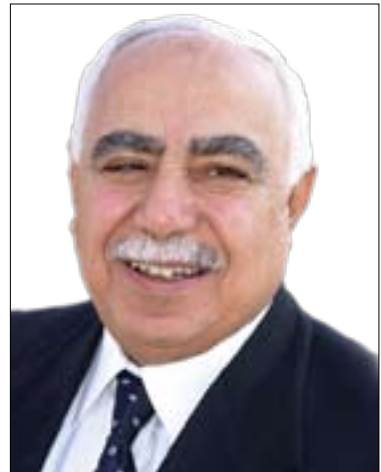
پروفیسور دكتور نازاد نەفشەندى

بىرپارە دواى يەك دوو مانگى تر ريفراندۆمىك لەباشورى سودان ئەنجام بىرئىت بۇ دەستىشانكردى چارنوسى ھەرئەكە بە جىبوونەو كە لە سودان و دامەزاندنى دەلەتتىكى سەربەخۆيان مانەو لە گەل سودان. ئەم ريفراندۆمە كە بىرپارە ئەنجام بىرئىت بەپىئى ئەو رىككەوتتەننامەبە كە واژۆ كراو، (رىككەوتتەننامەى ناشتى)، لەئىوان حكومەتى سودان و بەرى رزگارى باشورى سودان و تەنيا دانىشتووانى باشورى سودان، بەوانەبىشەو كە لەدەرەو كە ھەرئەكە نىشتەجىن، بۇ نمونە ئەوانەى كە خەلكى باشورى سودان و نىشتەجى «خەرتوم» ى پايئەختى سودان،