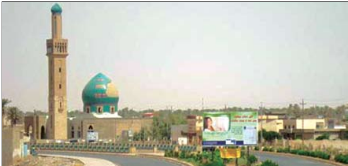
دابه‌ش‌کردنی کورد له‌ناوچه جیناکۆکه‌کان پیشیلکارییه‌کی ده‌ستووریه