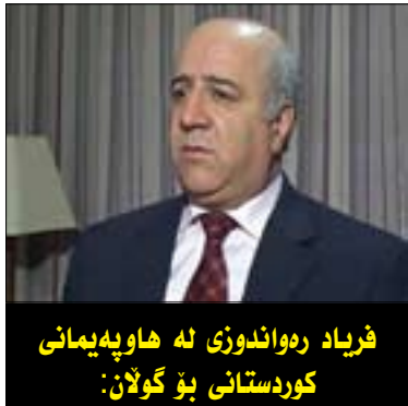
فریاد رەواندۆزی ئە هاویەییەکانی کوردستانی بۆ گولان:

ئەو مەترسیانەی مەزنده دەکرێت رووبەرۆوی باردۆخی عێراق ببێنەوه ئەو مەترسیانەن کە رێژ لە ئێرادی گەلی عێراق نەگێرێت