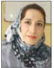
فیان ھەمە باتى