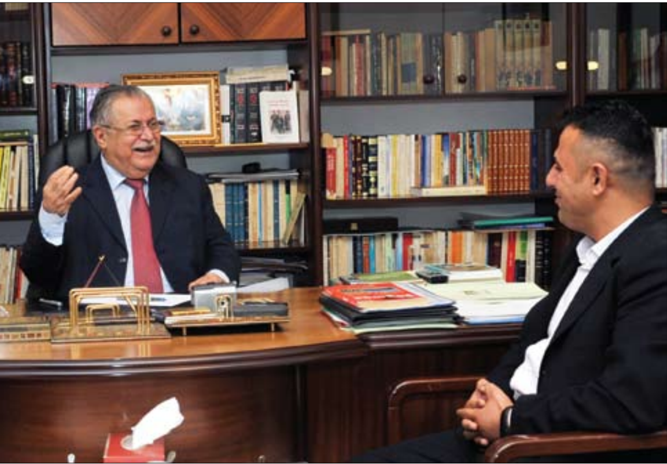
ئىمە پىمان خۇشە لەحكومەتى نوئ ھەموو لايەنەكانى ئىدا بەشدار بن، ئەمەش واتە ئىمە پىمان خۇشە عىراقىيەى ئىدا بىت، مەجلىسى ئىدابىت، ھەتا پىمان خۇشە لايەنىكى وەك حزبى شىوعىشى ئىدا بەشدار بىت

دىكەدا بىنەوہو بەشدارى بکەن. گولان: ئىستا لە پروسە پىكھىنانى حكومەتى داھاتوو عىراقدا كىشەى كاندىكردنى سەرۇك وەزىران يەكلابى بۇتەو، بىگومان بەرېژتان دەزانن راسپاردنى سەرۇك وەزىران پىوستى بە (%۱۰۰+)، بەلام بۇ سەرۇك كۇمار پىوستى بە دوو لەسەر سېى دەنگەكانە، ئەمەش ماناى ئەوئەيە دەيىت لايەنى كوردستانى پابەند بىت بە حكومەتى شەراكەتى نىشتمانىيەو بۇ ئەھدى