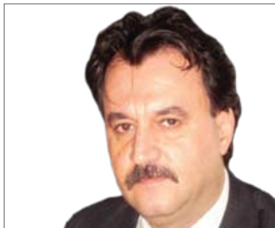
بەھات ھەسەب قەرەدەخى

تۆتۈرۈ مامۇستاي راگەياندىن پەيماننامەى شەرەفى كاردى رۇژنامەوانى، ئەو بەربەستە ئەخلاقىيە كە رى لە كەف و كۆلە دەروونىيەكان و ئەنگىزە نەبەجىكانى تاكى رۇژنامەنوس دەگرى و جۆرە سانسۆرئىكى خودىيە، تاك خۆى لەسەر خۆى دايدەنى، بۇ ئەوئەى سنورى ئازادىيەكانى خۆى بزائى و پىچ ئەئىتە نىو سنورى ئازادىيە تاكەكانى ترى نىو كۆمەلگەو . بەم مانايە، من بروام وايە بەمۆرکردن و واژۆكردى پەيماننامەى شەرەفى كاردى رۇژنامەوانى، رۇژنامەنوس خۆى ددخاتە ژىر بارئىكى ئەخلاقىي گرانەو و تارادىيەكى زۇرىش لادانە ئىتتىكىيەكان و بەزاندنى سنورى ئازادى و مافى ژيانى شەخسىي تاكەكان كالا و كەم دەبنەو . بەلام لىرەدا پرسىار ئەمەيە : ئايپا پەيماننامەيەكى لەمجۆرە تاچەند پىويستە بۇ مەيدىاى كوردى ؟ بەپرواى من ئەگەر پەيماننامەى شەرەف بۇ رۇژنامەنوسانى ولاتانى تریەك جار گرنىگ بىچ، ئەوا بىچ شك بۇ ئىمەى كورد، لەم ساتە وەختەدا سەد جار گرنىگترە . چونكە ئىمە، بەداخەو، سەرەتايەكى خراپمان دەستدووتى و ئەگەر زوو چارەى نەكەين، چەند سالىكىتر كار لەكار دەترائى و پەتاي ئەم بىچ سەرورەرى و فەوزايە بەجۆرئىك تەشەنە دەكات كە ئىدى مەحاله بە ئاسانى چارەبكرت . ھەر لەبەر ئەو سەرەتا خراپەيە كە لەنىو كايەى رۇژنامەوانى و مەيدىاكارىيە كوردى ئەم