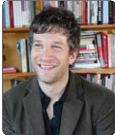
زۆر گرنگە لەسەر پېكھانىنى ناوخۆيى پارنە سىياسىيەكان گۆرانكارى ئەنجام بەدرىت

باشترىن رېگەچارە بۇ پارنە سىياسىيەكان ئەوھىيە كە نۆينەرايەتى ھاوولائىيانى كۆمەلگە و بەزۆھەندىيە گىشتىيەكان بەكەن