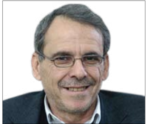
ئاسۆ که ریم

که شیکتی ئیجابیی بۆ لیکهالیبوون به دوا ی خۆیدا هینا. ئەم فراکسیۆنه، بۆ دانوستاندن له گه ل لیسته براوه کانی عیراقیدا (عیراقیه، ئیئتلافی دهوله تی قانون، ئیئتلافی نیشتمانی و ئەوانی دی)، چوارچۆیه کی هاوبه شی دانا و داخوازییه کانی له (۱۹) خا لدا چر کرده وه بهو لایه نهی سه ره وه ی دان. دیاره شه و به رنامه یه ئیراده و خواستی هه موو لایه نه کانی ناو فراکسیۆنه که ی له سه ره بووه، پیموانییه هیچ لایه نی له بهر خاتری لایه نیکی تر ئیمزای له سه ره کردی. به مانایه کی تر، ده کری بلین شه و به رنامه یه، تا راده یه کی زۆر ده رپری خواست و ویستی خه لکی کوردستانیشه. ئە گه ر فراکسیۆنی ناوبراو له دانوستاندن له گه ل لایه نه عیراقییه کاندا شیا قه ناعه تیان پیکات به نه جیندا و به رنامه (۱۹) خالییه که رازی بین، شه وه له کۆتادا، سه ره که وتنیکه بۆ هه مووان له م ساته وه خته دا و له هیچ کامیکیشیان قبول نا کری. به ته نی شه و «سه ره که وتن» ه، بداته پال خوی، یان