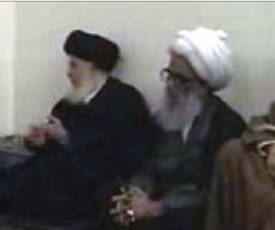
چوار مەرجەئەتە گەورەكەى ھەوزەى نەجەفى ئەشرف.. لە راستەوہ بۆ چەپ:

وڵاتە تابەزووترىن كات بتوانىت ھەموو كىشەكان چارەسەر بكرىن. گولان: ئايا ئەم شىكستە ماىەى نىگەرانىى سەماحتى شىخى نەجەفى نىيە؟ شىخ عەلى نەجەفى: يىگومان. بەلى زۆرىش نىگەرانبە و لۆمەى ھەموو ئەو كەسانە دەكات كە بەرپرسيارىن لە دواكەوتنى پرۆسەى پىكەپىناتى ھكۆمەت و پىى وايە كە ئەوان بەرپرسيارىن بەرامبەر خويى