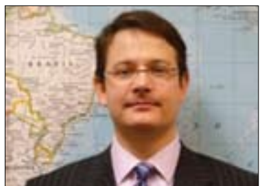
جاسون ریفاله بۆ گولان:

حزبه سیاسیه کان و پرۆسه ی هه لبه ژاردن کاری سه ره کی حزبه سیاسیه کان له کۆمه لگه ی دیموکراتی زه مینه سازیه بۆ بونیادی ئیراده و فۆرمه له کردنی میتۆدی هاندان بۆ به شداری سیاسی هاوولاتیان له پرۆسه ی دیموکراتی ولات، که واته ده کریت راشکا وانه تر له سه ر ئه م پرسه هه لوه سه ته بکه یین و ئامازه به وه بکه یین که پارته سیاسیه کان هه لده ستن به خا وکردنه وه ی ئالۆزییه