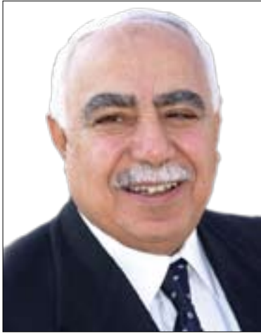
پروفیسۆر دکتور نازاد نەقشەبەندى