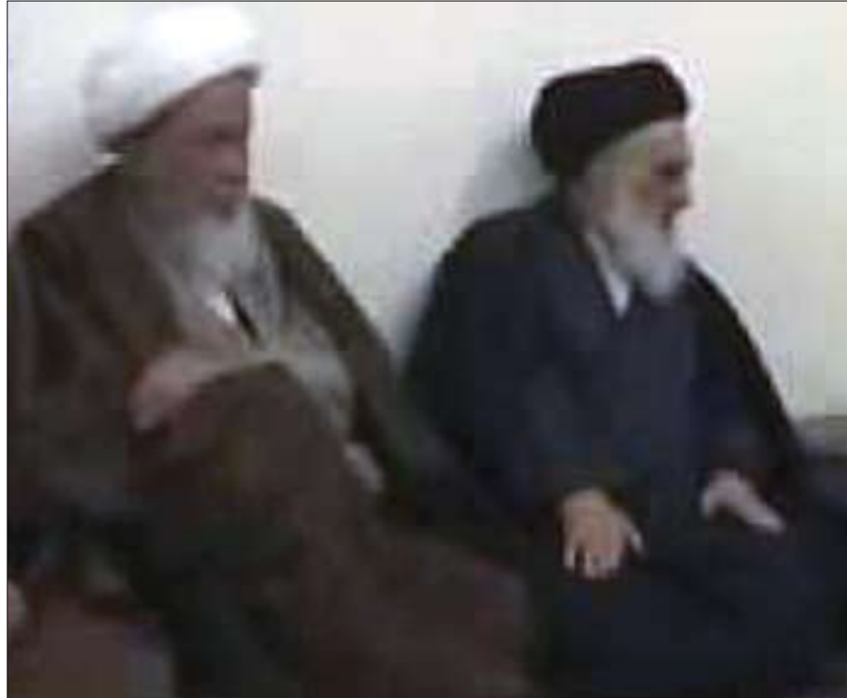
بەشیر نەجەفی، محەممەد سەعید حەکیم، سیستانی، محەممەد نەسحاق ئەلفیاز.

ئەم گەلە کە رۆژانە لییان دەکوژریت و ئەو پارە زۆرە کە بە فیروودەدرت، ئەوانە ھەموویان بە ھۆی ئەم دواکەوتنە لەبەردەم خۆدا و ئەم گەلە بەرپرسیارن. گولان: سەماحەتی شیخ، ئیمەتی کورد لە گەل مەرجەعییەتی نایینی شیخە خاوەن پەیوەندییەکی درێژ و دیرین، بەتایبەتی لە گەل مەرجەعیکانی نەجەفی پیرۆز، بەشیوەیەکی تایبەتی لە گەل سەماحەتی شیخ نایەتوللا «محسن حەکیم»، کە بۆ چەندین جار و لە چەندین بۆنە بۆ بەرژوونەندی کوردەکان فەتوای داوە. دەمانەوی بزانین کە نایا ئەمڕۆ ھەلوئستی مەرجەعییەتی نایینی بەرامبەر بە کوردەکان چییە؟ شیخ عەلی نەجەفی: گەلی کورد گەلیکی موسڵمانە و ھەکو عێراقی یەک خێران، بەشیکە کە لەم ولاتەدا