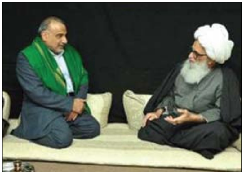
نایتوللا عوزما شیخ بەشیر نەجەفی و د. عادل عەبدولمەھدی

ئەم گەلە کە رۆژانە لییان دەکوژریت و ئەو پارە زۆرە کە بە فیروودەدرت، ئەوانە ھەموویان بە ھۆی ئەم دواکەوتنە لەبەردەم خۆدا و ئەم گەلە بەرپرسیارن. گولان: سەماحەتی شیخ، ئیمەتی کورد لە گەل مەرجەعییەتی نایینی شیخە خاوەن پەیوەندییەکی درێژ و دیرین، بەتایبەتی لە گەل مەرجەعیکانی نەجەفی پیرۆز، بەشیوەیەکی تایبەتی لە گەل سەماحەتی شیخ نایەتوللا «محسن حەکیم»، کە بۆ چەندین جار و لە چەندین بۆنە بۆ بەرژوونەندی کوردەکان فەتوای داوە. دەمانەوی بزانین کە نایا ئەمڕۆ ھەلوئستی مەرجەعییەتی نایینی بەرامبەر بە کوردەکان چییە؟ شیخ عەلی نەجەفی: گەلی کورد گەلیکی موسڵمانە و ھەکو عێراقی یەک خێران، بەشیکە کە لەم ولاتەدا