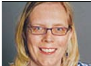
لويسا دىقىدسون بۇ گولان:

پىشتەر نامازەھمان بە گرنگى ديموکراتىزەکردنى ناوخۇيى حزبە سياسىيەکان کرد،