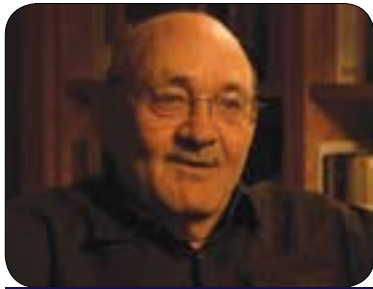
ئەمازيا بارام تايەتەند لە سەر عىراق بۆ گولان:

ئەم رووداوە تاجەند مەسىحىيەكانى توشى شۆك كەردووە يان كارىگەرى ئەو هەبىت كە رووداوى لەمجۆرە دووبارە بىتەو و بىر لەو بەكەنەسو زىدى خۇيان بەجىيەيلن و كۆچ بەكن، يوحننا سەليمان پىي و تىن: (ناتوانم بلىم دووبارە دەبىتەو يان نسا، بەلام ئەو تىبىنى دەكرىت هەندىكيان دووبارە دەستيان بە كۆچ كەردوو ٧٥٪ يان كۆچيان كەردوو و ئەو ٢٥٪ى ماوئەتەو لەنيوان بەغدا و كوردستان، لەبەغداش ئەوئەندە زۆر نين بەشى هەرە زۆريان