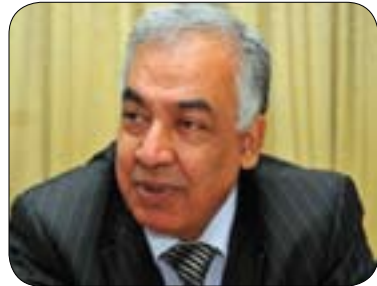
شاكر كىتاب سەرۈكەدى ئەنراقىيە بۇ گولان:

بەس نىيە، لەبەر ئەۋەى سىستەمە كە لەم روۋدە ھاۋچەشنى سىستى ئىسرائىلە كە سەرۈكى ۋەلات تەنيا نۆينەرايەتى ۋەلاتەكە دەكات و دەسەلاتتىكى ئەۋتۋى نىيە. كەۋاتە ئەگەر تالەبانى پۇستى سەرۈك كۆمار بىگىرتتە ئەستۆ، ئەۋا دەبىت راۋبۇ چوونى كارىگەرى ھەبىت لەۋەى لە ۋەلاتەكەدا روۋدەدات. ئىمە دەزائىن مالىكى ھىزىكى چەكدارى تايىبەت