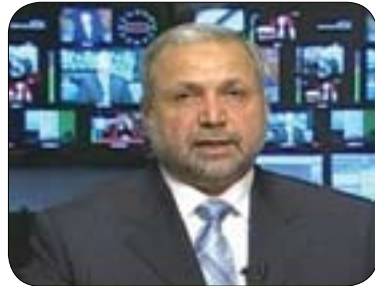
د. وه لید حلی سه رکرده ی لیستی ده ولته تى یاسا بو گولان.

هه له ی گه وره ی کردووه، به لام ته نانه ت شه گهر مالیکیش سه رهوک وه زیران بیته، شهوه دهسته بهرکردنى شه مافه ده بیته زه مانه تیک بو کورد و سونه کان. ئیمه ده زانین ریزیه کی زوری شه داواکاریانه قبو لکران که لیستی کوردستانی خسته یانه ته پروو، بو نمونه مالیکى نزیکه ی هه موو شه داواکاریانه ی قبو لکردووه، شه مه له کاتیکدا مامه له کردن له گه له عهللاویدا تا راده یه که سه ختته، شه ویش له بهر بوونى لیستی شه له ده دیا و که سانى وه که نوجه یفى له پیکهاته که ی عهللاویدا، شه کس و لیستانه شه به ره له سته داواکاریه کانى کورد ده کن. له راستیدا ده بیته کورده کان شه راستیه بزانه که ناتوان هه موو داواکاریه کانیه به ئینه دی. شه گهرچی رهنگه بتوانن زۆرینه ی شه داواکاریانه به ده سه ت به ئین. له مووه راسته مالیکى نزیکه ی به هه موو داواکارییه کانى کورد رازى بووه، به لام کیشه که شه و ديه مالیکى راهاتووه له سهر شکاندنى به لاینه کانى، شه به لاینى زور دهدات به لام هه موویان جینه جى ناکات. رهنگه پئوهندى ئیوه له گه له عه بدوله مه هیدا باشتر بیته، راسته عه بدوله مه هدی ده توانیته به لاینى به ده یه ئانه ی داواکاریه کی که متر به کورده کان بدات، به لام مه سه له که شه و ديه شه ههر کاتیک خوی پابه ند کرد به به لاینه که شه، شهوا شه گهرى زیاتره جینه جیانه بکات، له کاتیکدا رهنگه مالیکى بتوانیته به لاینى زیاتر بدات، به لام کیشه که شه و ديه ئیوه ناتوان پشت به به لاینه کانى به سه تن. نایته شه وه تان له بیرجیت که ده بیته