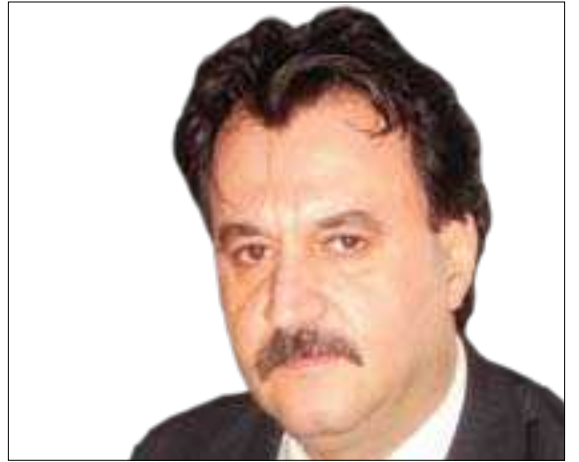
بەھات ھەسب قەرەداخى

بەيەكتەرگە ياشتنە! بەرلە خستنەرووى پرۇژەو پېشنيازكەم، بەپېئوستى دەزانم بەكورتى مەبەست لەھەردوو چەمكى ( لەيەكتەرگە ياشتن و بەيەكتەرگە ياشتن) روونبەكەمەوھ. ( لەيەكتەرگە ياشتن ) يەكىكە لە مەترسیدارترین دەرنەنجامەكانى ھەر پرۇسسىيىكى كۆمىونىكەيشنى شەكستخواردوو ( چ لەنېوان دوو تاك يان زياتردابى، ياخود لەنېوان تاك و گروپ يان گروپ و گروپدايى). كاتى كە ئامانج و وانا شاراوەو ئاشكاراكانى ھەر پەياميىكى ئاراستەكراو لە جەمسەرىكەوھ بۇ ئەويتەر، بەھەر ھۆيەكى فىزىكى، ئايدىيۇلۇژى، مېژوويى، دەروونى يان زارەكى بى، دەشپويى و بەو جۆرە ناگات كە خوازراو و پېشتر پلانى بۇ دارپىژراو. ئەو كات فىدباكىك واتا (كاردانەوھيەكى) چاوپرواننەكراو و نەخوازراو لە دووتويى پەياميىكى گەراوھە لەجەمسەرى وەرگەرەو ئاراستەي جەمسەرى دەسپېشخەر دەكرېتەوھ و بەگەيشتنى ئەم پەيامى كاردانەوھيەش، دەسبەجى جۆرىك لە شۆك و سەرسامىي لەملا سەرھەلئەدا، ئەوھش زۆرجار دەپتتە مایەي ھەلچوونىكى خېراي عاتقىي ئەوتۇ كە بارگە و تەزويەكى توند يان تەوس نامېژ دەكا بەبەرى ھەولېن پەيامى وەلامدەرەوھە لەھەمبەر ئەو فىدباكە چاوپرواننەكراوھى جەمسەرى دووھەمدا.. كەوابى ھەموو شەكستخواردنىكى پرۇسسىي پەيام ناردن، كاردانەوھيەكى