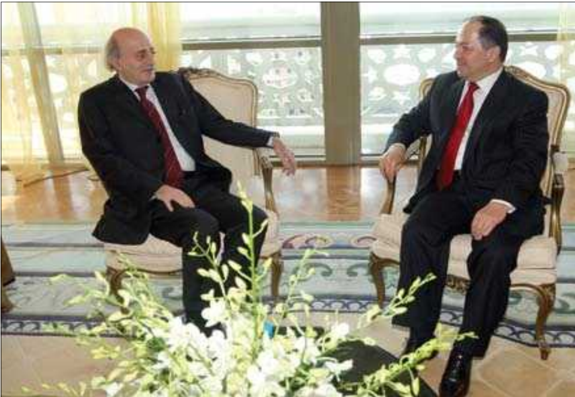
سەرۆك بارزانی لە گەڵ وەلید جونبلاز

سەرۆك مسعود بارزانییەكە جیگرەووی مستەفا بارزانییە، رۆلێكی گرنگ و كارێگەری هەیه لە دامەزراندنەووی عێراقی نوێ و بۆ رێكخستنەووی و بونیادنانی عێراقێكی فیدرالی