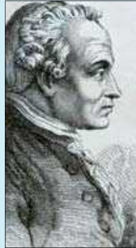
ئەمانوئیل کانت (کتیبی پرۆژەیی ناشتی ھەمیشەیی (۱۷۹۳))

بەپێی مانا گشتگیرەکانی نازادیش، کۆمەلگەییەکی ھەمەجی ییت یان کۆمەلگەییەکی سەرەتایی ییت، بەلکو پێویستە ئەو کۆمەلگەییە بەشپۆیەیک ریکبخریت بۆ ئەوەی تاکەکانی بتوانن نازادییەکانیان پیادە بکەن و نامانجە ئەخلاقەکانیان ییتەدی، ئەو ھەولەشی بۆ ئەو نامانجە دەخرتتە گەر، لە ناوەرۆکی خۆیدا نازادییە.