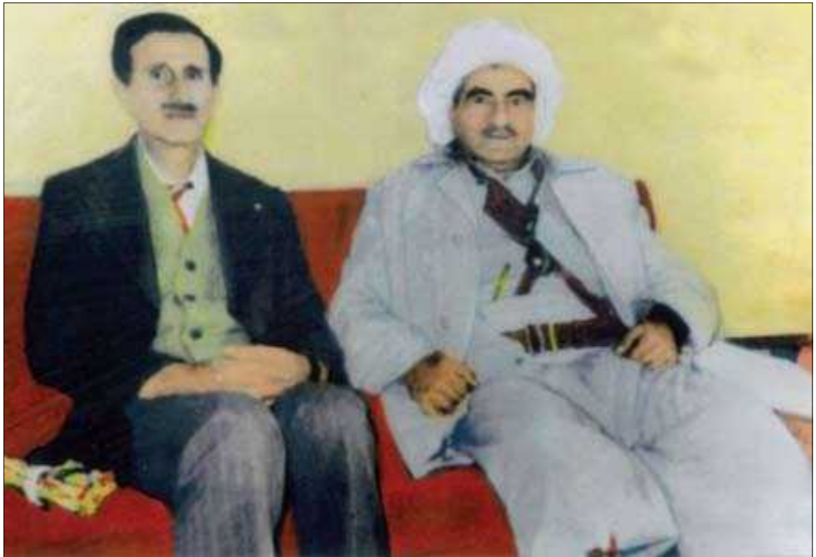
بارزانی نەمر لە گەڵ کەمال جونیلات

مستەفا بارزانی سەرکردەییەکی گەورە بوو ، خاوەن میژووویەکی بەرچاوە تەنانەت توانی لەگەڵ سوپای سۆقیەتی پێشوو (سوپای سوور) بجەنگیت ، پاوانخوازی و دەسەلاتی تاکرەوانەیی بەعسی رەتکردەوه