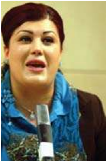
سەھیبە سوھیل بۇ گولان:

عیراق لە سالی نویدا دەرڤەتی ئەووی لە بەردەمدایە کە هاوکیشە کە بگۆریت بۆ ئەو سیاسەتە ی بەووی پیوستە چ شتیگ ئەنجام بدیرت بۆ چارەسەرکردنی کیشە هەرە زەحمەتەکانی ولاتە کە