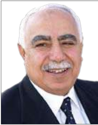
پروفېسور دكتور نازاد نەقىشەندى

بەرھەمى لاواز و بىسود و تەنيا بايەخ بە چەندايەتى بەرھەمەكان دەدەن و جۇرايەتى لە بىردەكەن دەبنە ھۆكۈمىتىنىڭ دروستىۋىنى دىيارەدى، («بەبىيانبون» ى ھزر). ئەم لەشكەرە بى شومارە، كە ھەر ھەمىۋىيان ناۋيان لە خۇيان ناۋە، يان ئىمە ئەو نازناۋەمان پىنەخشىيەن، رۇژنامە-نوس، ھونەرمەند، چاۋدېرى سىياسى... تاد، بەي ئەۋى شايەستە ئەو نازناۋانەن، بەلگەى حاشاھەلنەگى دابەزىنى ناستى ھۆشيارى نەتەۋىي ۋ ھزرە لە كۆمەلگەكەماندا.