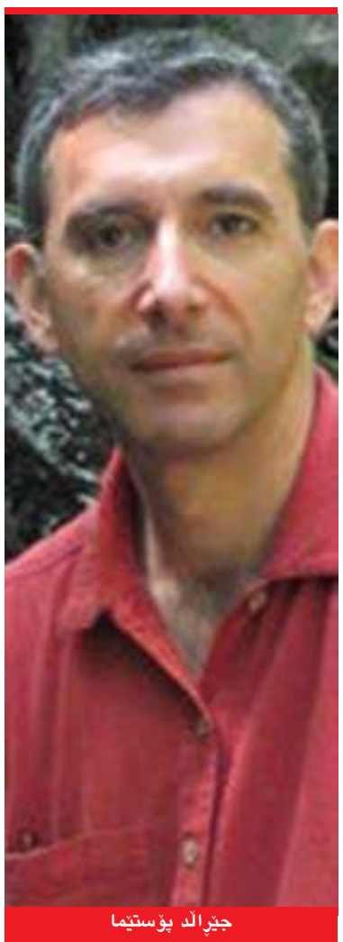
جىرال د پۇستىما

خۇيان بكن... يەكىك لە رېنگاكان بونى سىستىمىكى ياسايە كە ھەلبىستت بە داينىكردنى پارىژگارى بۇ مافى تاكەكەسەكان، بەلام پېۋىستە لە ھەمان كاتتدا كۆمەلگەيەكى بەھىزت ھەپتت تىپدا تاكەكەسەكان ھەست بكن بەشىكن لە سىستىمىكى كۆمەلايەتتى گەۋرەتر و ھەست بكن پارىژراۋن، لە لايەكى دىكەۋە دەپتت لە روۋى ئابۋورىشەۋە پارىژراۋن، واتە مافە بنەرەتتەيەكانى مرۇف داينى كرايىتن بۇ ئەندامان و تاكەكەسەكانى كۆمەلگەكە. من پېم وايە ئەساسىكى