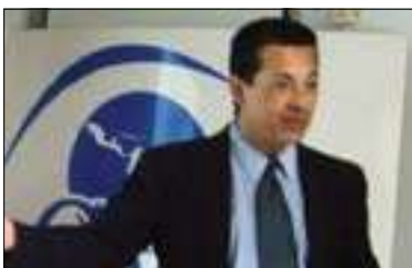
ھومام سەدرى بۇ گولان:

هیچ ئاستەنگىك لەبەردەم جینە جیگردنى ماددەى ۱۴۰ نىیە، پىنموايە ئەمجارەیان كەشوهەواى دروست رەخساوہ بۇ چارەسەرکردنى هەموو كىشەكان