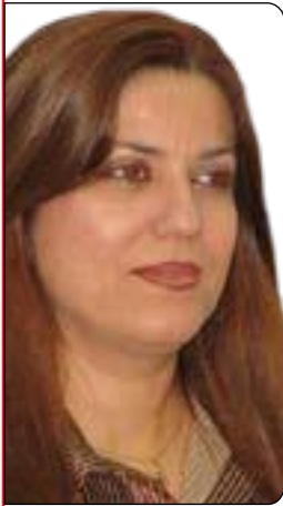
فینۆس فایه ق

ده زگا خزمه تگوزاریه کانی حکومت له یه کدی جیابکه یینه وه، بۆ ده سته بهر کردنی زیاترین بر له نارامی سیاسی و پارێزگاریکردنی پینگه ی دین له ناو کۆمه لگادا و چیدی هه موو روژ مه لاکان به ناوی دینه وه فه توادان نه کهنه کار و پیشه ی روژانه یان.