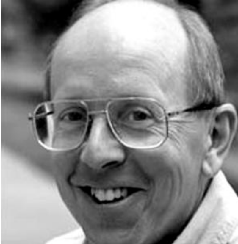
دېفيد بۆينك ئوستادى ئىنكى رۆژنامەوانى بۇ گولان: