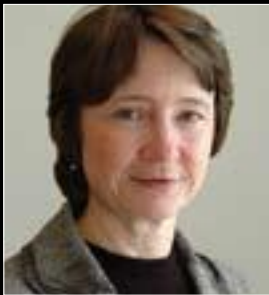
پروفىسۇر ئىپ لەيوك زانكۆى تارتو - ئىستونىيا

دەركەوت ، رۇژنامەنووسان بەوجۇرە تەرجمەي ئازادى رۇژنامەگەريان دەگرد وەك ئەوہى ئازادى رەھا بىت ھىچ رىكخستىكى پىويست نەبىت، ھەربۇيە ئەم حالەتە بووہ ھۇكارى ئەوہى ژىنگەيەكى نالەبارى ئەوتۇ دروست بىت، ئازادى وەك ئازادى رەھا پىناسە بكرىت و ھىچ پىويست نەبىت ئەوہ لەبەرچاوبگىرىت چى دەلین و چۇن دەيلین، ئەمەش بووہ ھۇكارى ئەوہى بەشىۋەيەكى پراكتىكى مۇرالى كارى رۇژنامەگەرى پروفىشنال پىشەيبكرىت و واىگرد ھاوولاتيان متمانەيان بە مىديا كەمبىتەوہو، ھەروہا بووہ ھۇكارى ئەوہى بۇ رووبەروووبوونەوہى ھەندىك حالەتى ئەو پىشلكارىانە رىگەى دادگا بگىرىتە بەر، بىگومان ماوہى پركردنەوہى ئەو بۇشاييە مۇرالىيە لەولاتىكەوہ بۇ ولاتىكى دىكە دەگۇرىت، ھەربۇيە لە ولاتانى پۇست كۆمونىست نەك ھەر بۇ راستكردنەوہى ئەم بارودۇخە پەنايان بۇ ياسا بردووہ بۇ ئەوہى بارودۇخەكە رىكخاتەوہ، بووہ ھۇكارى ئەوہى لەزۇر ولاتدا دەولەت ناچار بىت دەستىۋەردان بكات)).