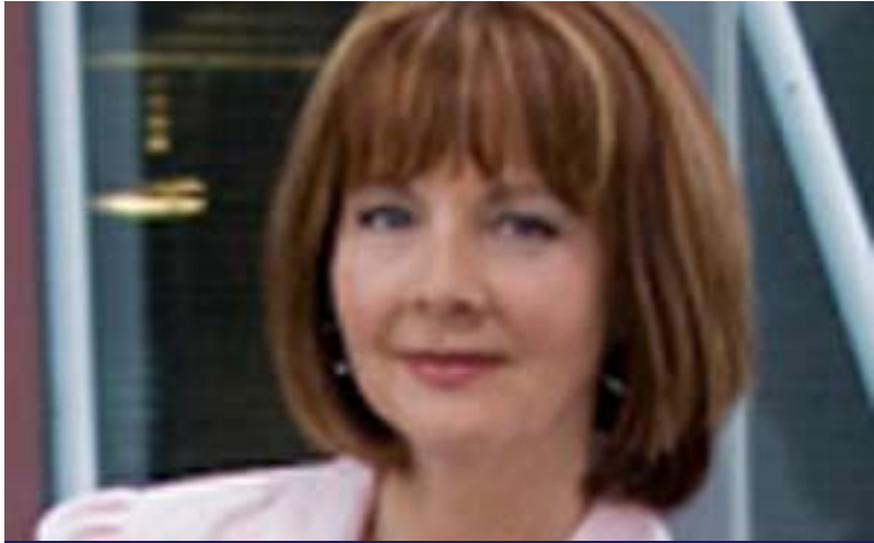
بۇنى براونلى (جىگرى راگرى كۆلىزى رۇژنامەگەرى لى زانكۆي ئىندىيانا) بۇ گولان: