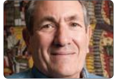
بارى ستاين بۆ گولان:

پروڤيسور باري ستاين ئوستادى زانستى سياست له زانكوى ميشيگان و تاييه تمه ند له سهر سياستى ئەمريكا بۆ ولاتانى باكوورى ئە فرىقا و رۆژهلالتى ناوهراسست بهمجۆره راي خۆى بۆ گولان خستهروو و وتى: (پيش هموو شتىك سازدانى ئەم ريفراندۆمه زۆر گرنگه، له بهر ئەوهى شەرى پيشوو له سوداندا نزيكهى مليونيك كوزراوى ليكهوتۆتهوه، ههروهها ئەگەر ئەو شىوازى پيادهدەكرىت بۆ مامهله كردن