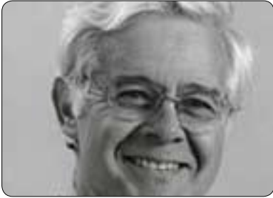
نيلسن كاسفير بۆ گولان:

سابقه يه ك بۆ چاره سه رىكى ناشتيانه بۆ ناكو كيه كانى تر كه له ناوچه كه دا بوونى هه يه، سه باره ت به پيوه ندىه كانى نيوان ولاتانى ناوچه كه به تاييه تى له سه ر كيشه ي ئاوى نيل، بيگومان پىكه اتنى حكومه تى باشورى سودان ده يته مايه ي ئالۆز كر دنى هه ولە كانى «ميسر» و «باكوورى سودان» بۆ كۆتۆ لى كر دنى ئاوى «نيل». به لام له وانىه زيادبوونى ولاتىكى تر ئەگه ره كان كه مده كاته وه بۆ ده ستپيشخه ريه كى سه ربازى