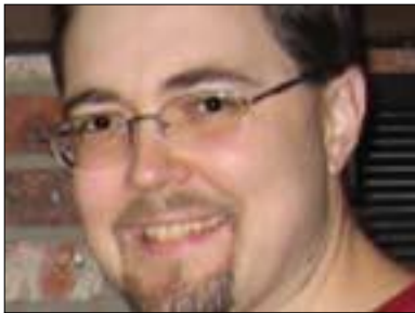
دال توگۆ بۆ گولان:

بونیادی ده‌وله‌تی نه‌ته‌وه‌یی ئاماده‌باشی بۆ ده‌ستیکی رۆشنگه‌ری هه‌یگل که‌ شۆرشێ فهره‌نسای ناو لینا کۆتایی میژوو، بونیادی ده‌وله‌تی نه‌ته‌وه‌یه‌ی وه‌ک دواییین ئامانجی نه‌قل له‌ شیوه‌ی ده‌رخستنی ئیراده‌ی تاکه‌کان بۆ گه‌یشتن به‌ ئازادی کردیه‌ی پیناسه‌ ده‌کات، له‌ کتێبی دووه‌می ئیو موجه‌له‌دی کاره‌ ته‌واوه‌کانی هه‌یگلا و له‌به‌شیکدا به‌ناوینیشانی (یاسا وه‌ک بنه‌مایه‌ک بۆ ده‌وله‌ت) ده‌لێت: (بنه‌مای ده‌وله‌ت ته‌قله‌ که‌ به‌شیوه‌ی ئیراده‌ ده‌رده‌که‌ویت .... هه‌ربۆیه‌ ده‌وله‌ت له‌ خۆیدا بۆخۆی پیکهاته‌یه‌کی ته‌خلاییه‌وه‌، ده‌یه‌ته‌ هۆکارێک بۆ به‌دیپینانی ئازادی به‌کرده‌وه‌یه‌ی، ته‌مه‌ش ئامانجی ره‌هایه‌ بۆ نه‌قل، بۆ ته‌وه‌ی ئازادی به‌شیوه‌یه‌کی کردیه‌ی بیته‌ دی... ته‌وا له‌به‌ر ته‌وه‌ی ده‌وله‌ت بوونی رۆحه‌ له‌سه‌ر زه‌وی، ته‌وا به‌هۆشیاری