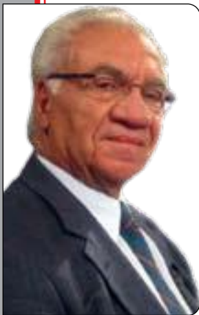
کازم حهیب *