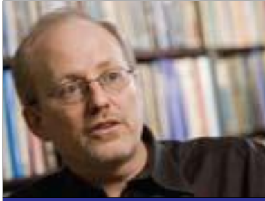
تىمور كۆران بۇ گولان: