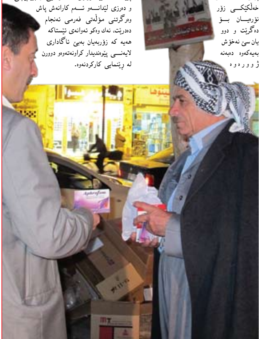
ھەروەھا راپوچوونى ئىمە وەكو سەندىكاى پزىشكان لەسەر عيادەى لاكۆلانەكان ئەو ھەيە كە لە ١٠٠٪ دابخرىن، چونكە ئەوانە زۆرىيان مومارسەى كارى پزىشكى دەكەن و داوودەرمانىش دەفرۆش كە ئەمەش لە دەرەو ھەموو رېنمايى و ياساكاندايە . بەلكو كارى ئەو يارىدەدەرى پزىشكانە فرىگوزارى سەرئتابى و برىنيچى و دەرزى لىدانەو ئەم كارانەش پاش وەرگرتنى مۆلەتى فەرمى ئەنجام دەدريت، ئەك وەكو ئەوانەى ئىستاكە ھەيە كە زۆرىيان بەيىن ئاگادارى لاينەى پىوئىدىدار كرانەتەو دوورن لە رېنمايى كاركردەو .

سەندىكاى پزىشكانى ھەرىمى كوردستانە . بەلام تا برايم سىكتەر و پۆلى سىكتەر لە يەكتر جيا نەكرىتەو ئەو رەنگە ئەو ھالەتەنە روودبات، چونكە پزىشك رۆژانە پىيەكى لە نەخۇشخانەيەو پىيەكىشى لە نۆرىنگەكەبەتى، ئەگەر بىت و ئەو پزىشكە مياك بىت دەنا ھەر كىشەمان لەم لاينەو بۇ دوست دەبىت . لەبارەى پاكوخاوتنى نۆرىنگەكان لەلاين سەندىكاى پزىشكان چەندين رېنمايى و مەرج دانراو ھەر بەھۆى ئەو مەرج و رېنمايەنەو ئىستاكە زۆرەيى نۆرىنگەكانى پزىشكان زۆر پاكوخاوتن و سەردەميانەن و جياوازيبەكى باش لەگەل ٤سالى پىش ئىستاكە ھەيە . بەلام نۆرىنگەش ھەيە بەپىنى مەرج و رېنمايەكان نييە . لەلايەكى ترەو بۇ چارەسەركردنى كىشەكان و رىكخستنى كارەكانمان لەگەل وەزارەتى تەندروستى بەگشتى و بە ھەماھەنگى پىكەو ھەندئ كاردا ئەوان دەست دەخەنە ناو كارەكانمان و ھەندئ جارىش ئىمە لە ھەندئ كاردا دەست دەخەينە ناو كارەكانى وەزارەت، ئەمەش دەگەرئتەو بۇ ناروونى لە ھەندئ ئىشوكارداو ئەو دەست تىووردانەش ھەندئ كىشەو گرفت لە نيوانمان دوست ھەروەھا ئەو پزىشكانەى خەلكىكى زۆر نۆرىيان بۇ دەكرىت و دوو يان سى نەخۇش بەيەكەو دەبەنە ژوو رەو .