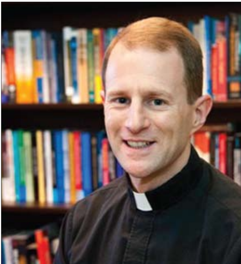
ماسیۆ کرۆین بۆ گولان: