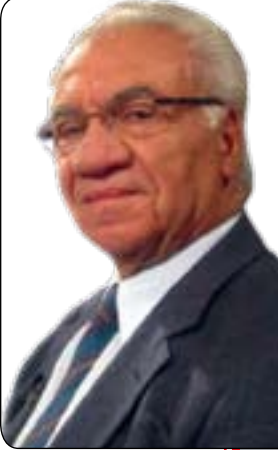
كازم حەيب * ۲۰۱۱/۱۱/۲۸ (۸۵۶)

وئىراى بەردەوام بوونى خەباتى گەلى كورد له هەرچوار پارچەكەدا بۇ وەدەستەپىنانى مافە رەواكانىي و له پىشيانەوه مافى پريرادنى چارەنووس، بەو شۆبەيهى له راگەياندنەكەى كۆمەلەى