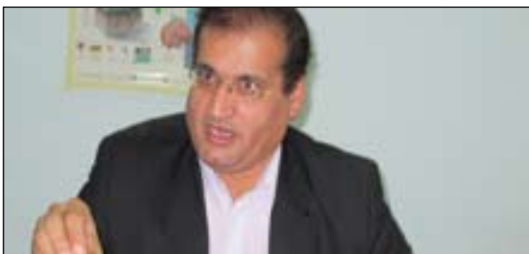
سه روکی سه ندیكای پزیشکانی کوردستان لقی هه ولیر:

له سه ره تای سالی ۲۰۱۲ دهست به جیبه جیکردنی ریفورمی ته ندروستی دهکەین